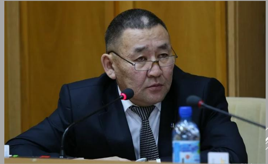
Пётр Револьдович Аммосов Депутат Государственной Думы Федерального Собрания Российской Федерации