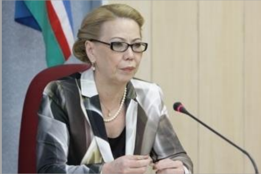
Галина Иннокентьевна ДАНЧИКОВА Депутат Государственной Думы Федерального Собрания Российской Федерации